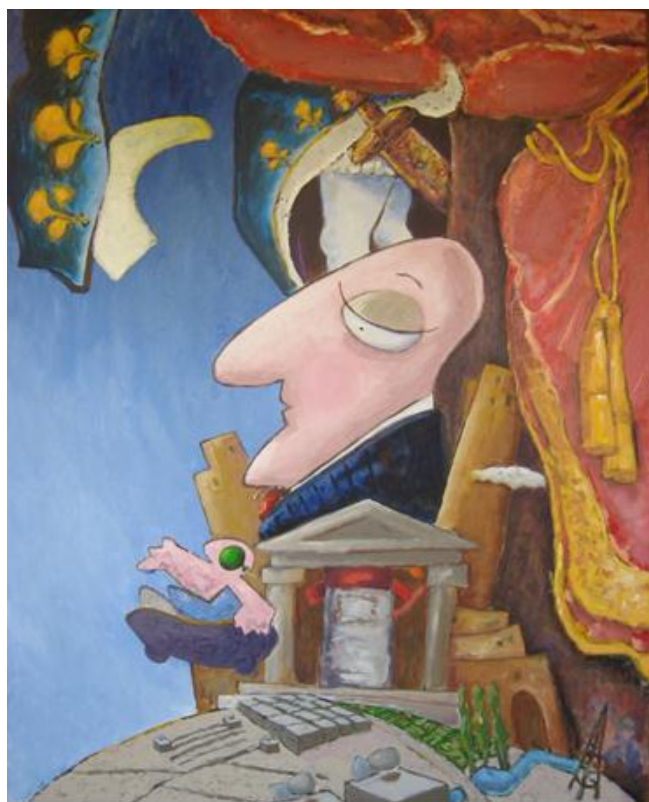
El Rey Sol, acrílico sobre lienzo

Como todos los artistas De Jesús a pasado por distintas etapas y su obra actual incurre en un estilo de carácter surrealista pero con una temática muy propia y de profundo significado. Su imaginaria es densa y compleja, de mucho trabajo y cargada de fuerte contenido, aún cuando en algunas piezas muestra