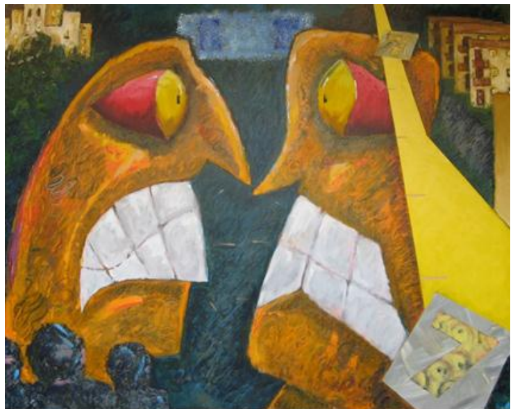
La nave de los locos , acrílico sobre lienzo

AICA - Asociación Internacional de Críticos de Arte, Vice-Presidente Internacional