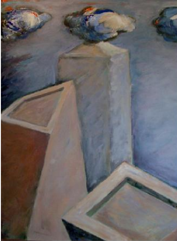
Lluvia sobre la ciudad , acrílico sobre lienzo

se nos presenta Paisaje con llave . Esta obra, en la que predomina diversas tonalidades y gradaciones cromáticas de colores cálidos, reta al espectador a una reflexión sobre nuestro mundo actual.