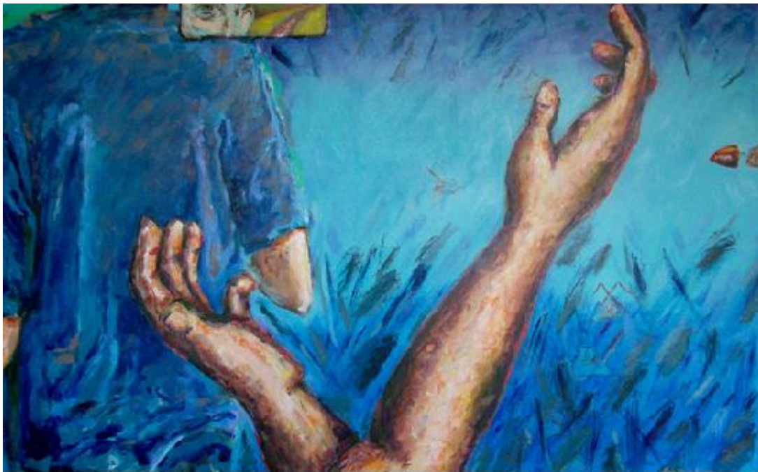
La Danza de la muerte, acrílico sobre lienzo