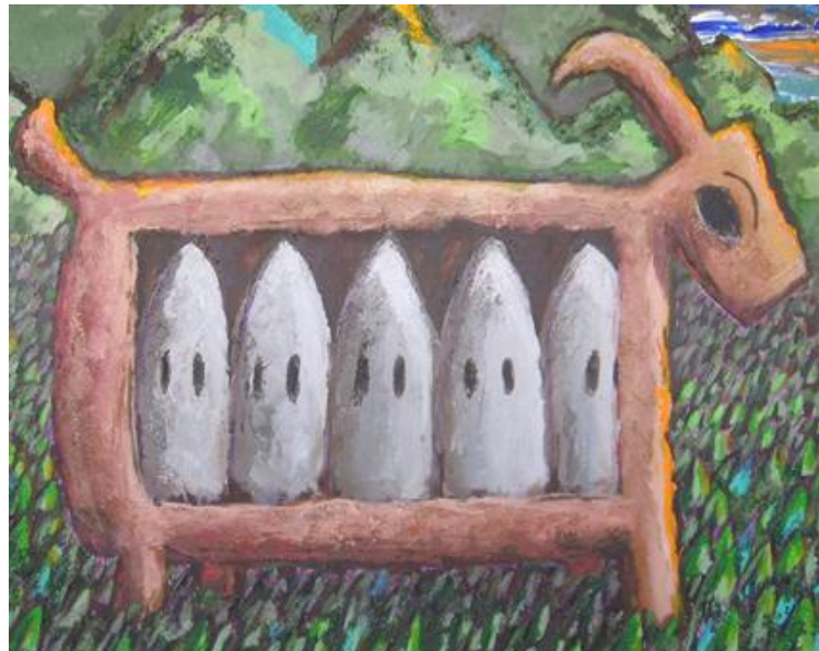
Los hijos de la cabra, acrílico sobre lienzo