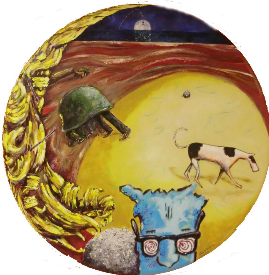
Absalom , acrílico sobre lienzo