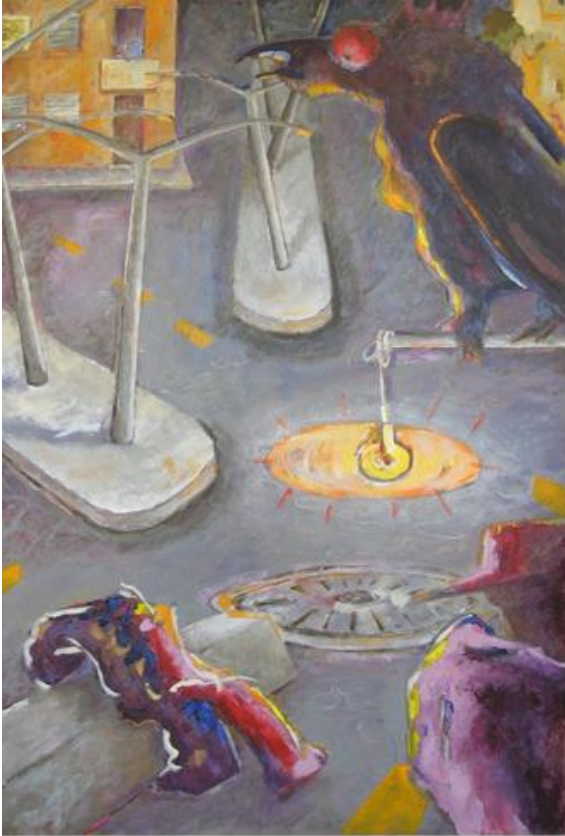
Cuatro esquinas, acrílico sobre lienzo