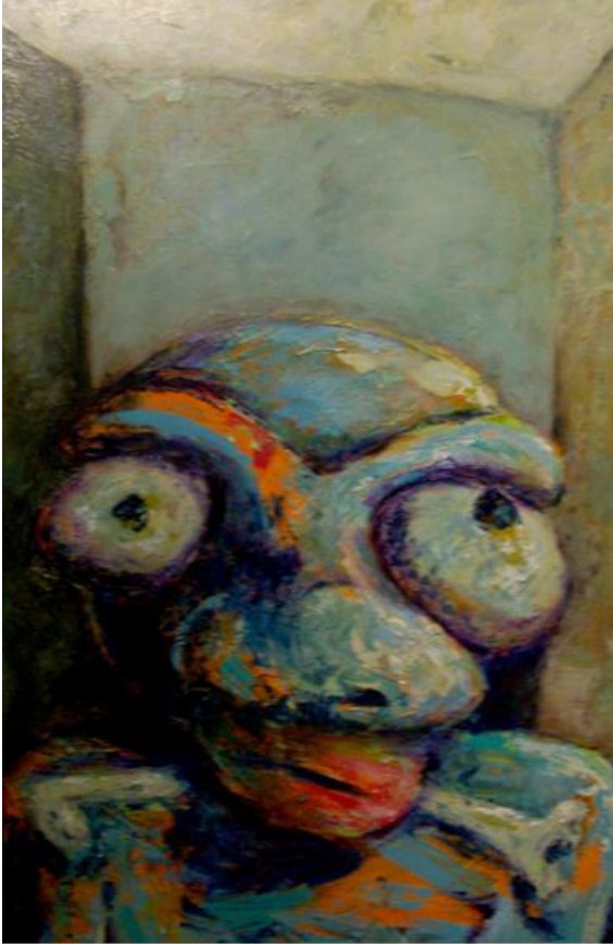
Requiem abruña , acrílico sobre lienzo

pero grotesco y que retan a una reflexión sobre la sociedad en general.