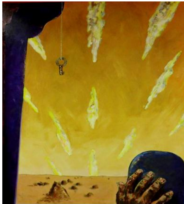
Paisaje con llave , acrílico sobre lienzo

Lluvias sobre la ciudad , de orientación vertical y de colores neutrales aunque claros es una manifestación más sobria. La sensación que produce en el espectador es distinta ya que lleva más hacia una reflexión. De manera similar aunque con una alegoría un tanto distinta,